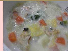
クラムチャウダー