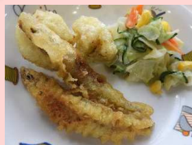
わかさぎのカレー揚げ

2月の旬の食材…わかさぎ・あさり・金目鯛・ふぐあさり・小豆・水菜・くわい・春菊・大根・白菜ほうれん草・いよかん・国産オレンジなど