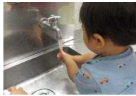
きれいにゴシゴシ