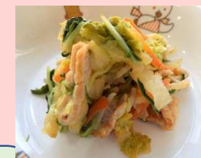
白菜と水菜のお浸し

2月のメニューでは根菜カレーライス・春菊と白菜のお浸し・クラムチャウダーわかさぎのカレー揚げなどがあります。