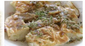
そうめん入りお好み焼