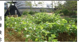
毎月実施 避難訓練 安全点検 月例健診