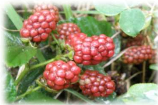
ブラックベリーです