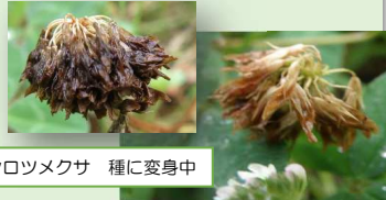
シロツメクサ 種に変身中

先日、調剤薬局で順番を待っていると、1歳前後の男の子とお母さんが入ってきました。長椅子に男の子はお母さんと座り、ここはどこかな？と周りを見渡し、お母さんの反応を見ていました。薬剤師さんが用紙をもってきて、お母さんと話をする様子も、彼はじっと見つめていました。説明を聞いたお母さんは用紙を受け取り、膝で彼の安全を守りながら、さらさらとボールペンを動かし記入を始めました。すると彼は手を伸ばして触ろうとしましたが、手はパタパタと空を舞い、膝に戻り、彼はまたお母さんの顔と手元を見て、パタパタ手を伸ばして…を繰り返してはお母さんを見ていました。私は、子どもたちが持つ、この好奇心が嬉しくなっていました。