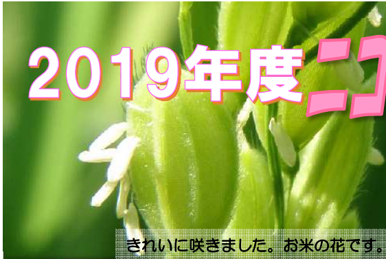
きれいに咲きました。お米の花です。